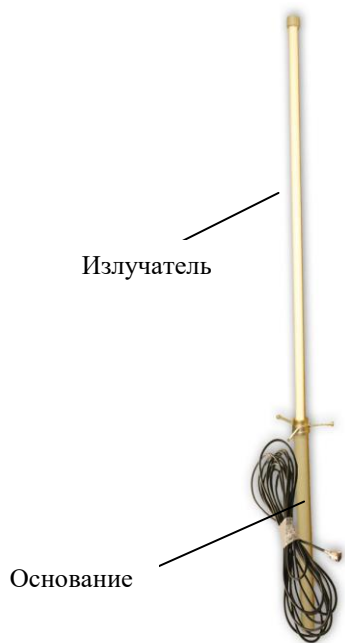
Рисунок 1 - внешний вид антенны