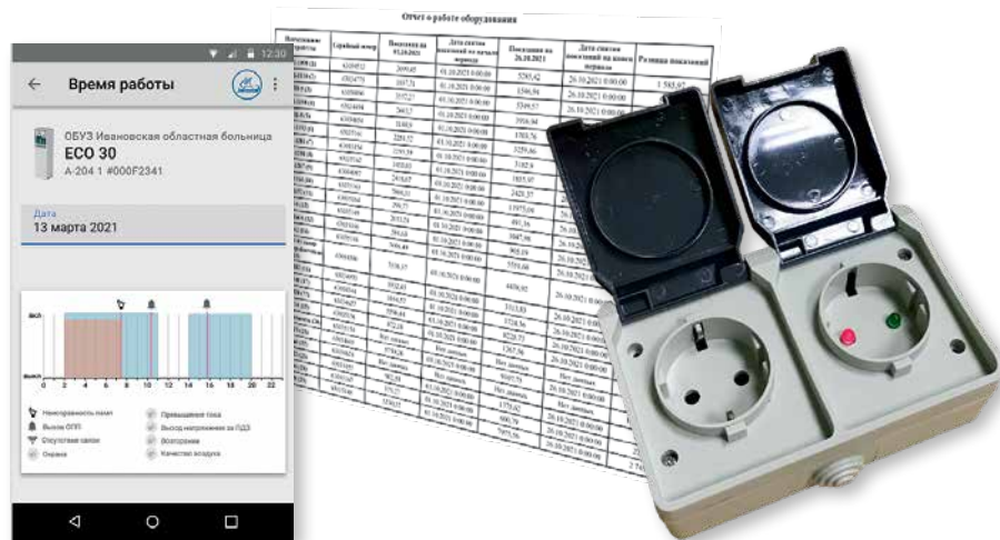
Рис. 2. Компоненты системы IoT-контроля УФ-рециркуляторов

Влажное, теплое помещение больницы палаты – идеальная среда для размножения бактерий и вирусов. Небольшое повышение температуры