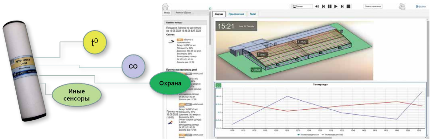
Рис. 3. Система на базе устройств МУР 1001.5 TDT для контроля климатических параметров в помещении

в хранилище вакцины – потеря дорогостоящего препарата.