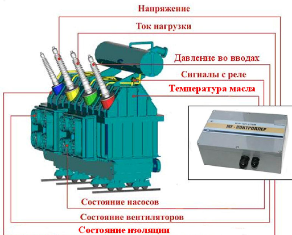
Рис. 1. Регистрируемые параметры трансформатора

Практически все системы мониторинга нацелены на оценку состояния изоляции как наиболее важного и наиболее подверженного разрушению элемента масляного трансформатора. Для этой цели используют оценку режима нагрузки трансформатора, контроль температуры наиболее нагретой точки, определение влагосодержания в бумажной изоляции, определения тангенса угла диэлектрических потерь. Далее в списке приоритетов стоит контроль состояния системы охлаждения, при оценке эффективности которой используются обычно следующие параметры: температура верхних слоев масла, разница температур масла на входе и выходе системы охлаждения, температура окружающей среды, состояние маслонасосов и вентиляторов (рис.1).